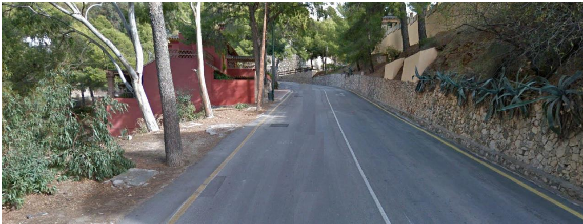
Imagen 6. Detalle de una de las calles que llevan al inicio de la ruta. Se aprecia la fuerte pendiente y la ausencia de aceras.

Hay que añadir que el camino a pie hasta el punto de inicio de la ruta puede ser complejo por la alta pendiente del camino, la ausencia de aceras en algunos puntos, así como por el tiempo que se emplea en llegar, el cual puede ser superior a 1 hora.