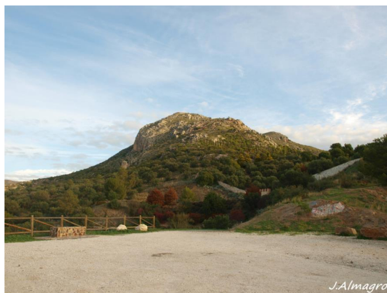
Imagen 3. Llano para dejar el coche.