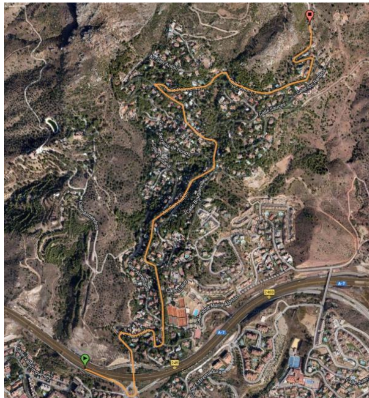
Imagen 4. Mapa de la ruta circular

b) Si la ruta que queremos realizar es la ruta circular que comienza por la parte este: