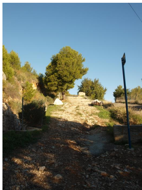
Imagen 5. Monolito que indica el inicio de la ruta