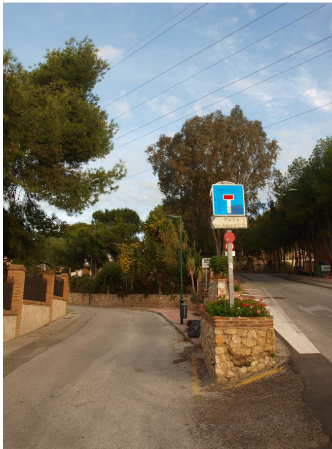
Imagen 2. Desvío a Calle Almendros